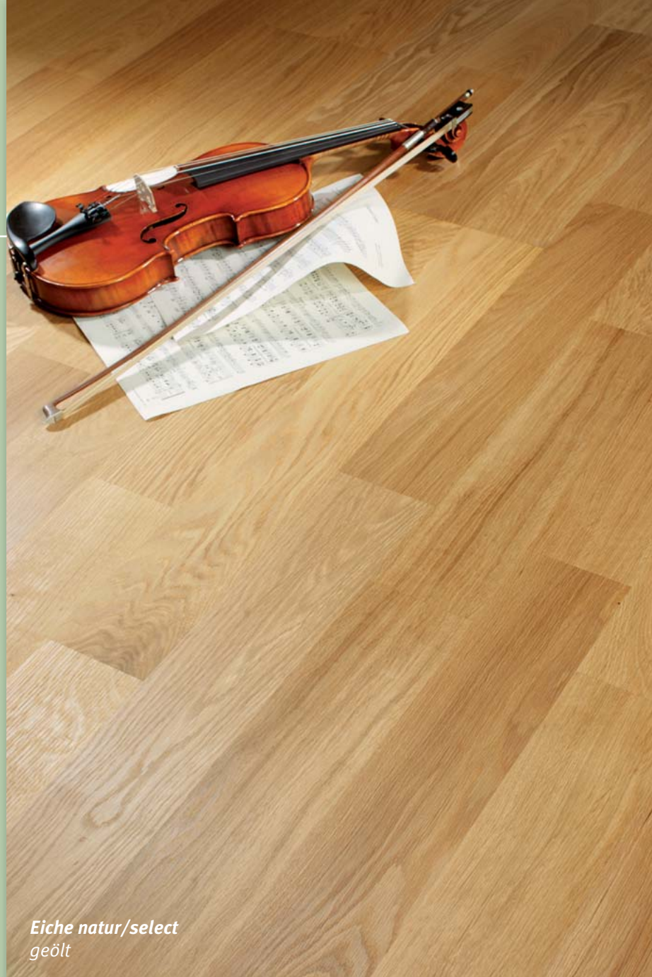
Eiche natur/select geölt

Sie sorgt für ein extrem formstabilen und qualitativ hochwertiges Holzfertigparkett.