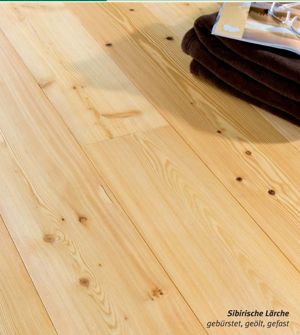
Sibirische Lärche gebürstet, geölt, gefast

Holz-Fertigparkett. Leimfrei. Perfekt selbst verlegt.