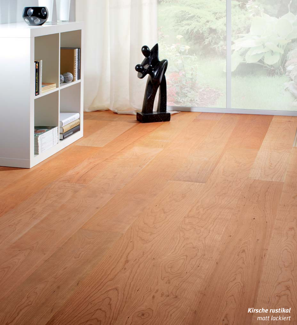
Kirsche rustikal matt lackiert