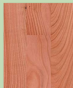
Europ. Kirschbaum natur