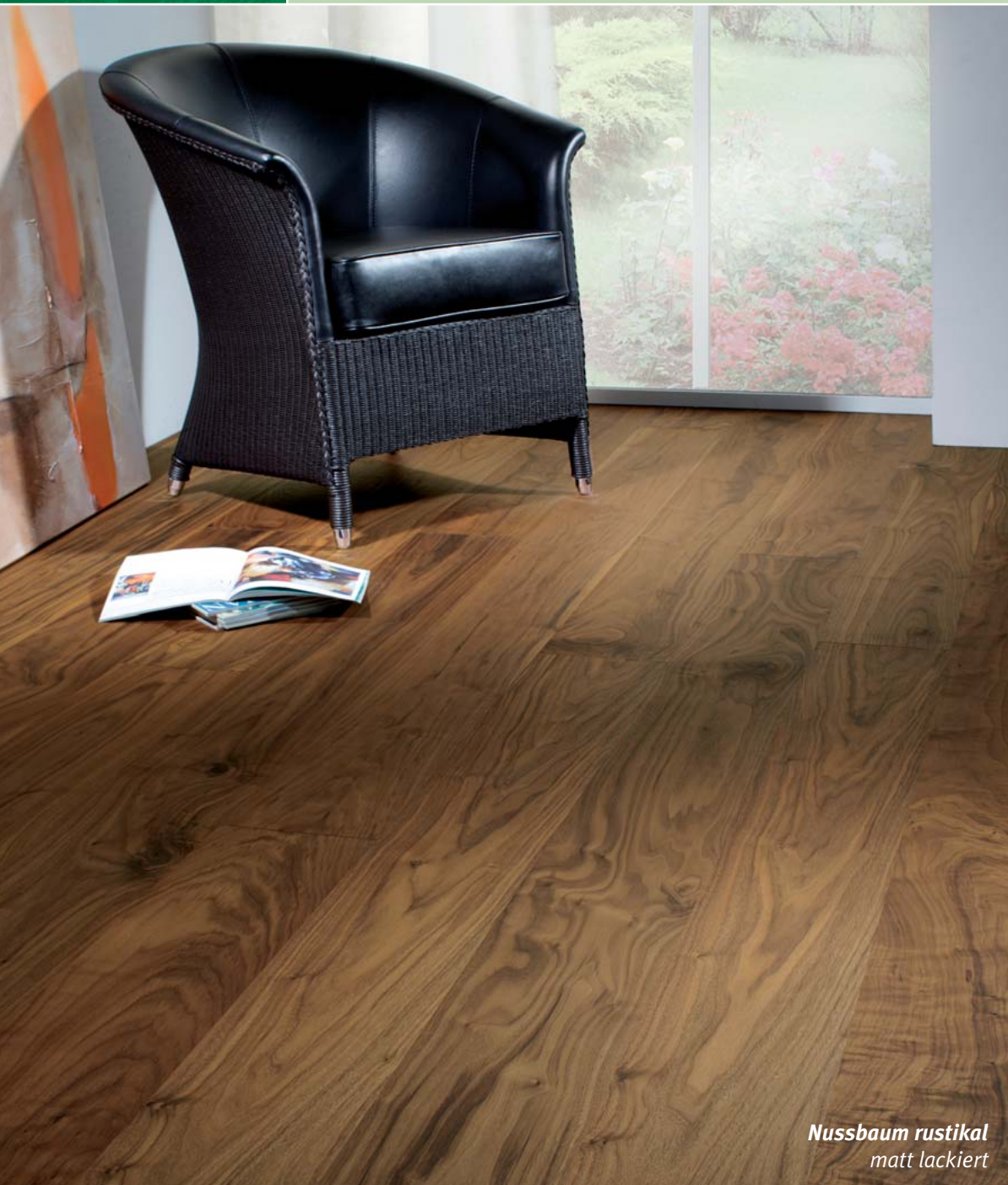
Nussbaum rustikal matt lackiert

HOLZLOC Holz-Fertigparkett. Leimfrei. Perfekt selbst verlegt.