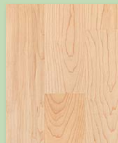
Kanad. Ahorn natur/ select