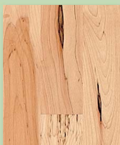
Kanad. Ahorn rustikal