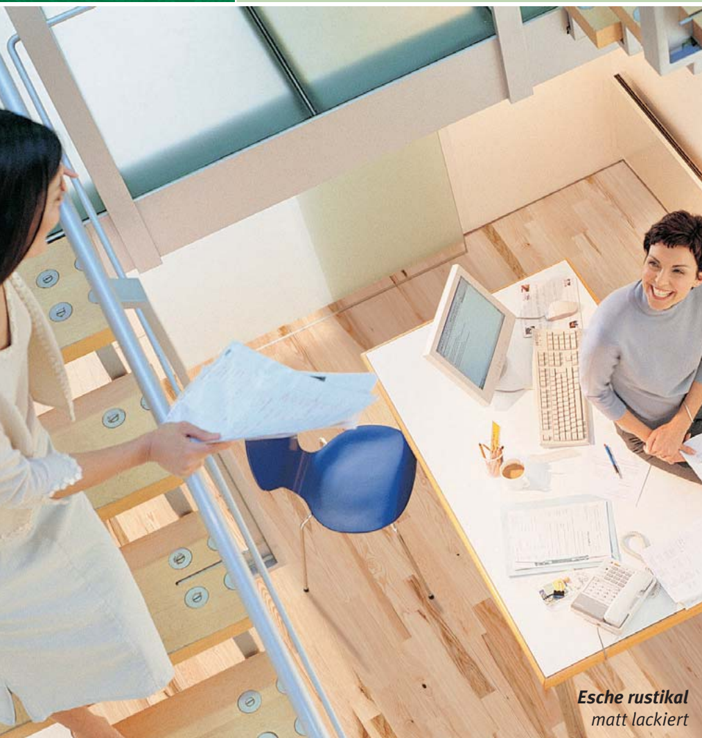
Esche rustikal matt lackiert

Holz-Fertigparkett. Leimfrei. Perfekt selbst verlegt.