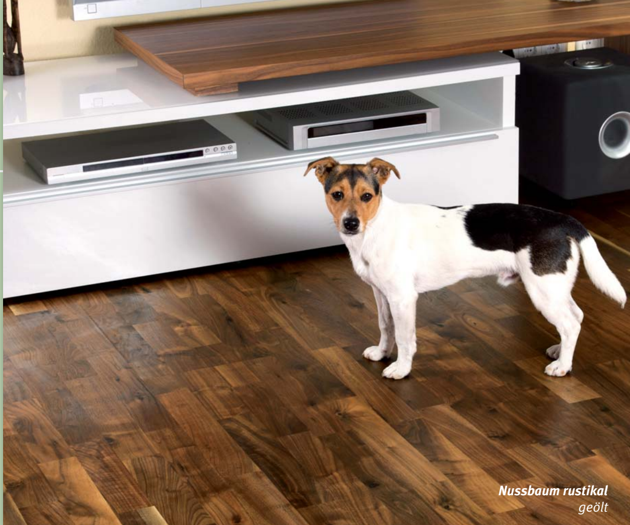
Nussbaum rustikal geölt